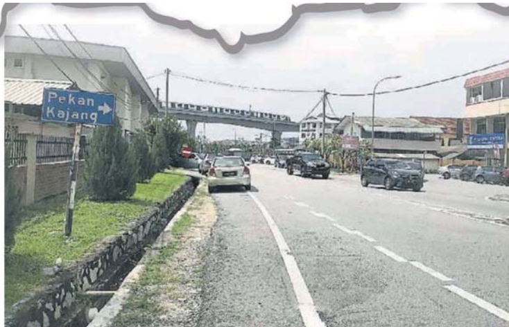
居民建议教堂旁的道路，衔接上流古路。