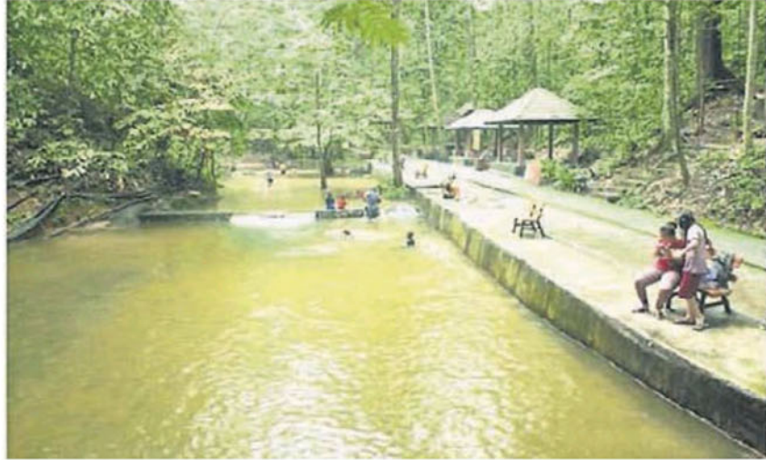
■ 冷河瀑布成为雪隆一代居民的假日休闲去处。