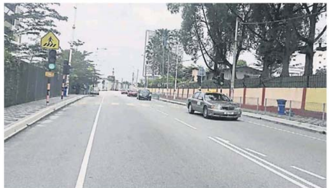
武吉路将加宽为来回 4 条车道，建在马路保留地的学校篱笆受促拆除。

“兴建 U 转天桥是要纾缓该路段和天桥底下斯里珍拉丽斯的交通堵塞问题，同时，士毛月往柏丽玛绍佳娜花园等地的车辆，也可使用新的天桥驶入。”