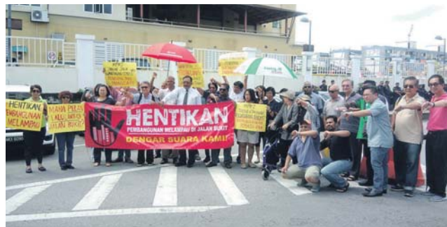
Antara penduduk yang hadir menghantar memorandum kepada MPKj.

Beliau berkata, apabila projek pelebaran jalan ini siap kelak, berdasarkan Kajian Impak Trafik jalan berkenaan