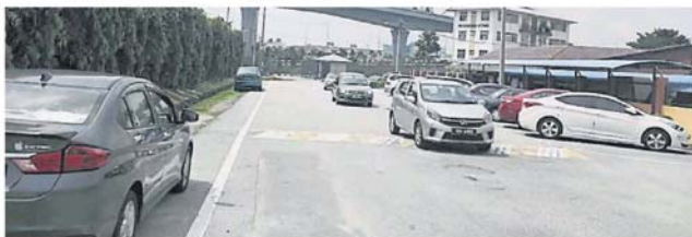
姑娘堂中小學的通道目前是单向道，当局研究以加宽为双向道，衔接武吉路和流古路。

“不过，因学校的篱笆建在马路保留地上，以致有的路段来回只有一条车道，因此校方受促把学校的篱笆移进学校范围。”