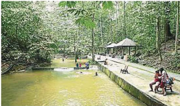
冷河瀑布成为雪隆一代居民的假日休闲去处。