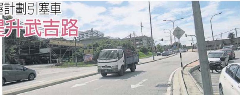
4条车道。市议会认为，武吉路仍有空间提升为