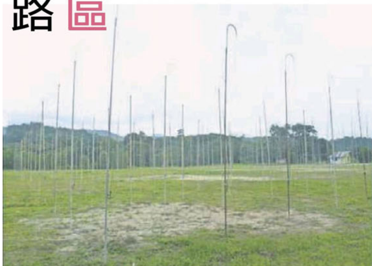
■ 甘榜巴西斑鸠鸟声比赛场也在每个月的最后一个星期日主办斑鸠歌唱比赛。