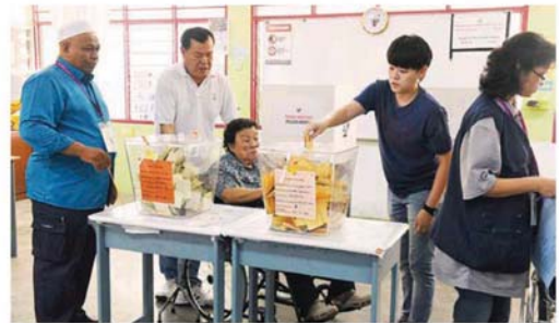
金马仑补选，被视为希盟政府对垒国阵政府之战。(档案照)