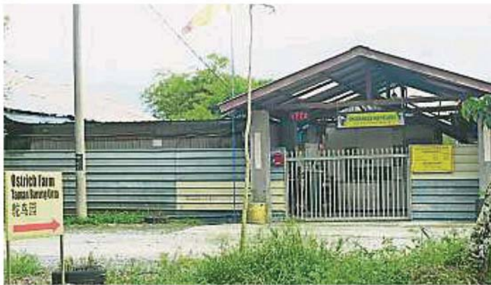
甘榜巴西峇鲁的鸵鸟园。

(士毛月20日讯) 联邦政府、雪州政府、加影市议会和士毛月州议员服务中心，将联手打造士毛月双溪拉郎路 (Jalan Sungai Lalang) 为国家自然休闲旅游区，以吸引国内外的游客前往观光。